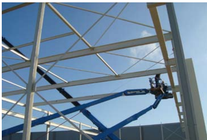
Het zetten van de constructie verloopt voorspoedig.