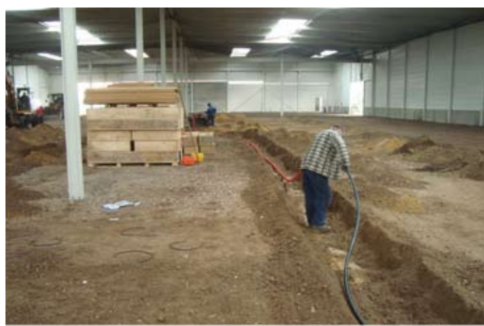
Het leggen van de benodigde voorzieningen is ook gestart.