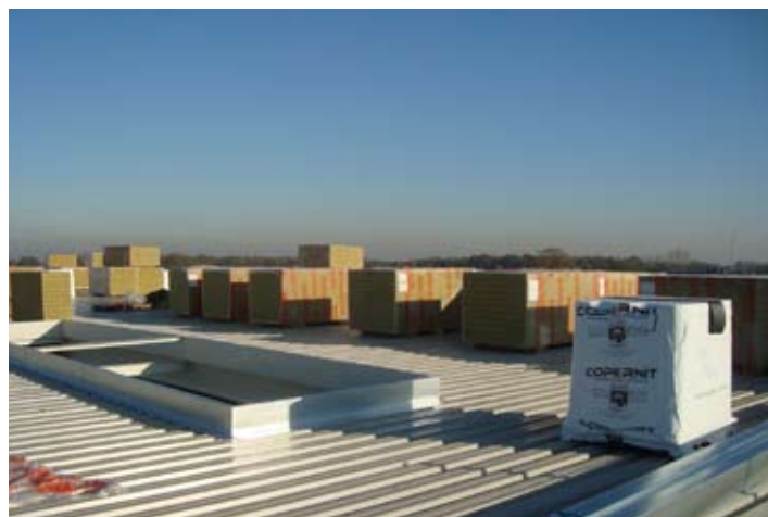
Het dak is dicht en kan worden geïsoleerd.