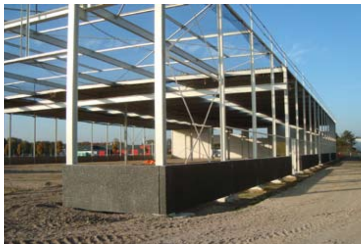
De buitenzijden worden voorzien van bekleding.