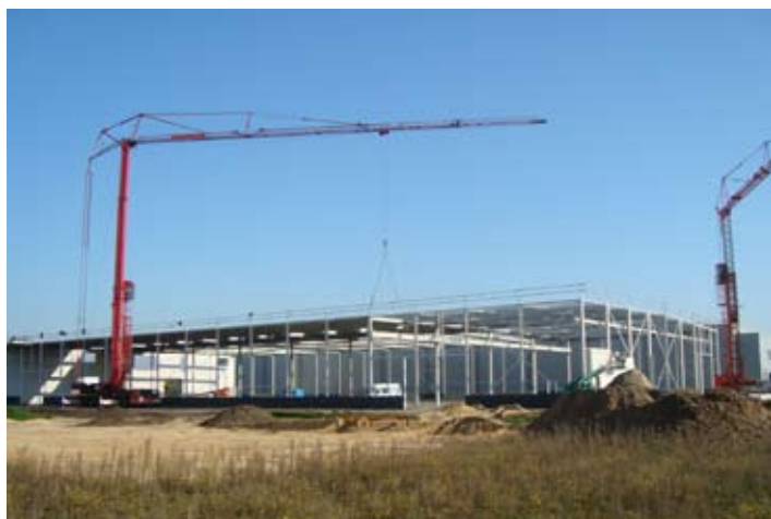
Aanblik van de nieuwe productielocatie vanaf de straat.